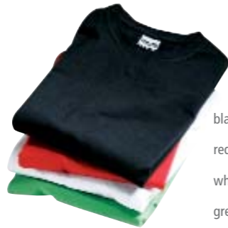
black red white green