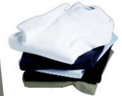
white navy light blue black khaki